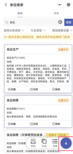
②添加至已选经营范围中