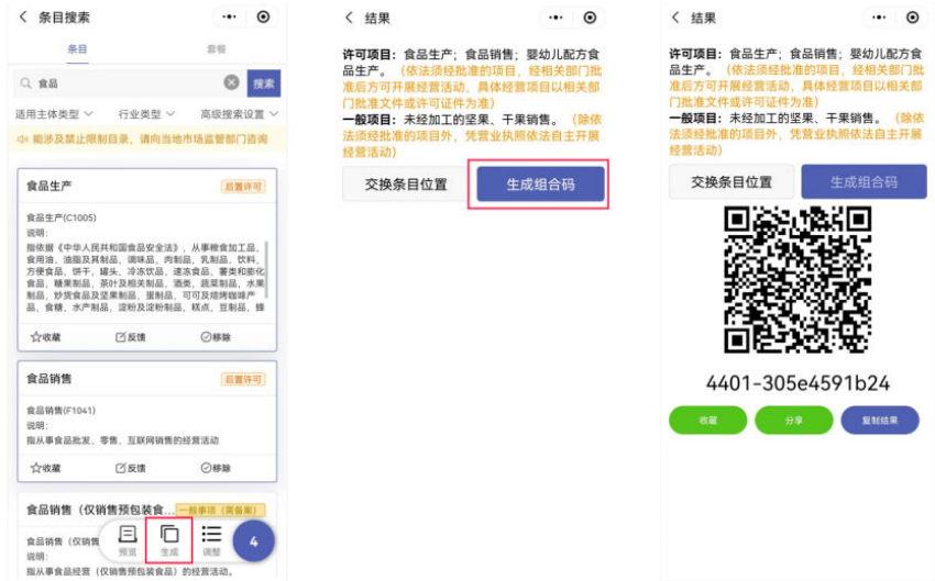
①点击[生成] ②点击[生成组合码] ③生成组合码