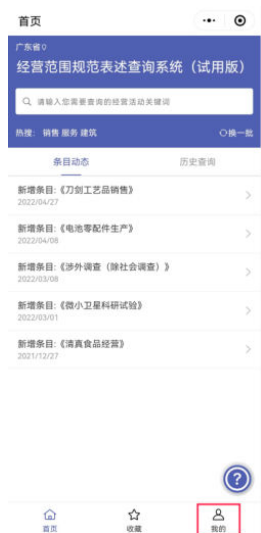
①在系统首页点击[我的]