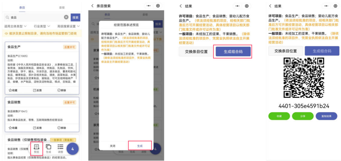
① 点击[预览]按钮 ②点击[生成] ③点击[生成组合码] ④生成组合码

若符合实际生产经营活动需求，可点击[生成]-[生成组合码]，即可生成规范化经营范围。