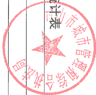
台山市城市管理和综合执法局 2023 年度行政检查实施情况统计表