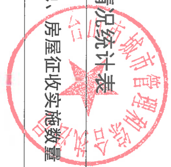
台山市城市管理和综合执法局 2023 年度行政征收实施情况统计表