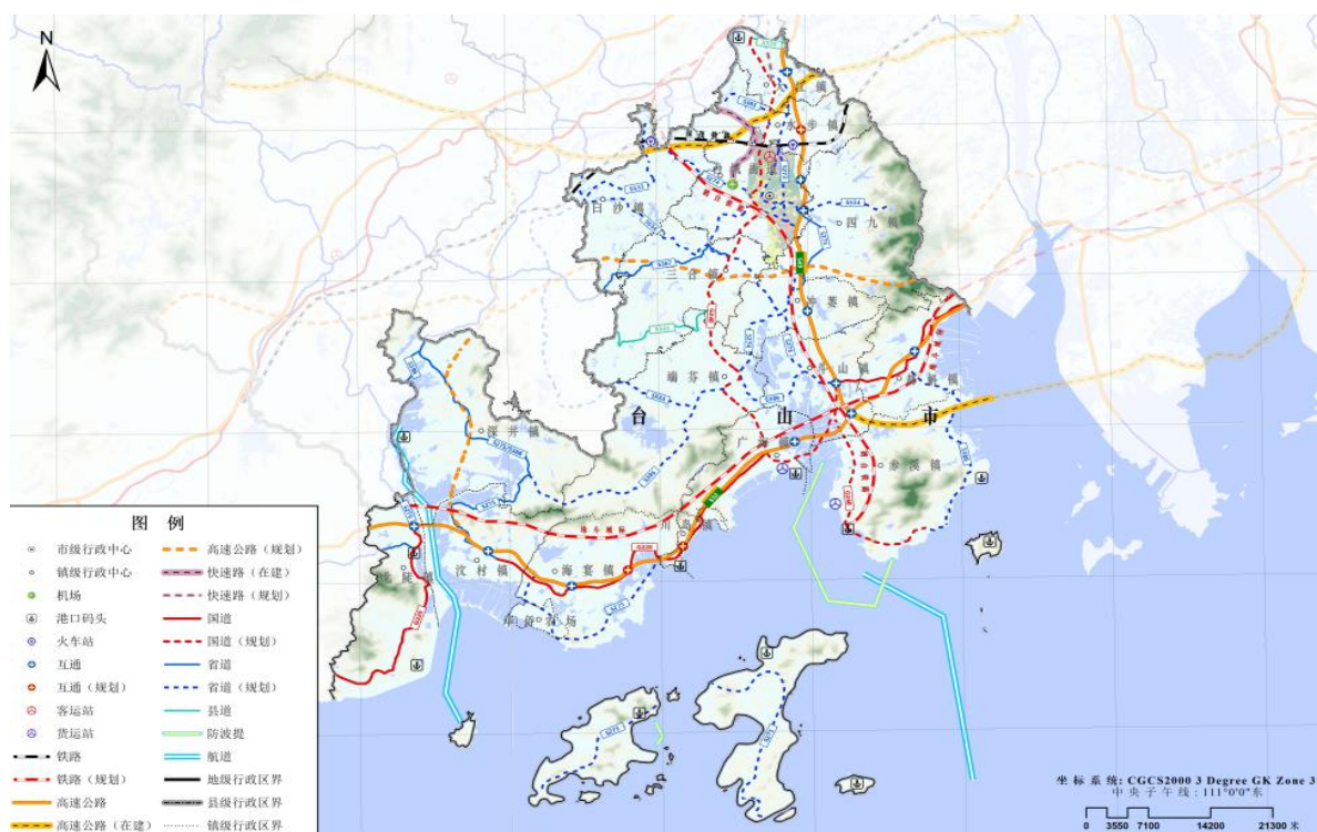
图 8-1 台山市市域综合交通规划图