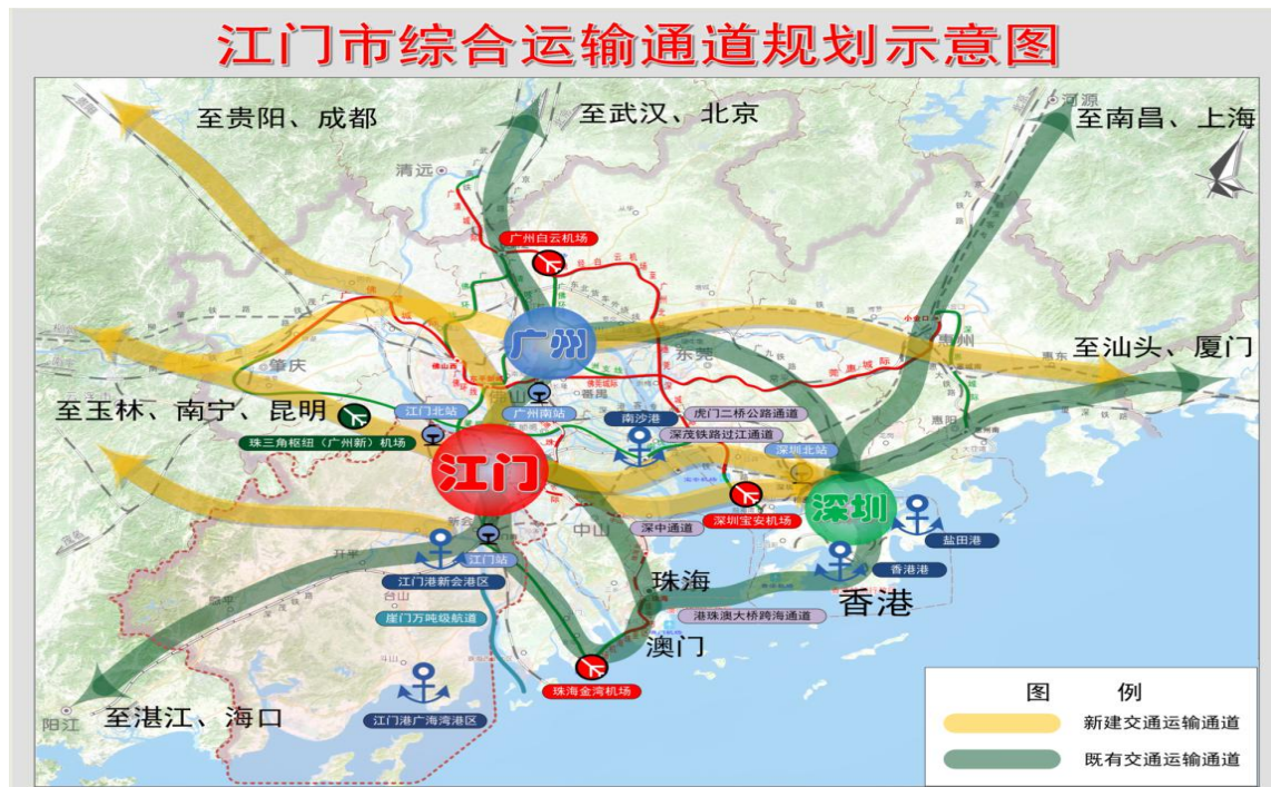
图 5-2 江门综合运输通道规划示意图

着力培育驱动现代经济发展的枢纽经济新范式。建成珠三角西岸区域交通枢纽，打造协同广深、联动泛珠三角、辐射东盟等海上丝绸之路地区的重要枢纽节点。以交通枢纽为平台，以沿海、沿江、沿线交通网络为支撑，促进资源要素向江门集聚，为广佛、深港地区重要产业向江门转移创造良好环境。依托综合交通枢纽的城市综合体和产业综合区，形成层次分明、运营高效、衔接顺畅、服务优质的综合运输服务体系。重点发展以鹤山陆港为中心的珠西物流中心，建设面向雷州半岛、粤西及大西南的物流快递分拨、货运调度组织中心，推进多式联运型和干支衔接型货运枢纽、物流园区建设，推进传统公路、铁路货运场站向城市物流配送中心、现代物流园区转型发展。参与珠三角枢纽（广州新）机场前期选址、规划、建设，以及机场地面交通组织的规划，在鹤山前瞻性规划面向珠三角枢纽（广州新）机场的空港经济配套设