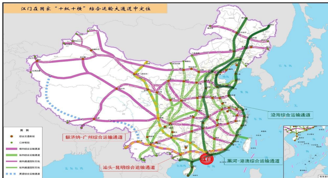
图 5-1 江门在国家“十纵十横”综合运输大通道中定位

建设对接港珠澳大桥、深中江阳通道、南沙大桥等珠江口高速公路过江通道。推进中山至开平高速公路等珠三角西岸重要高速公路建设，形成连接粤东西地区的深（圳）中（山）江（门）阳（江）大通道。推进广（州）中（山）江（门）高速公路等建设，形成连通广（州）佛（山）江（门）肇（庆）云（浮）的东西向通道，密切江门与顺德、南沙等联系。推进黄茅海跨海通道项目工作。提升高速公路互联互通水平，加强高速公路与沿江沿海港口、重要城镇、经济开发区、产业园区、城市新区、物流站场的连接。推进建设年限较早、交通繁忙的高速公路扩容改造和分流路线建设，提升既有高速公路通道容量。预留斗（门）恩（平）高速、广中江高速西延线等东西向通道资源。