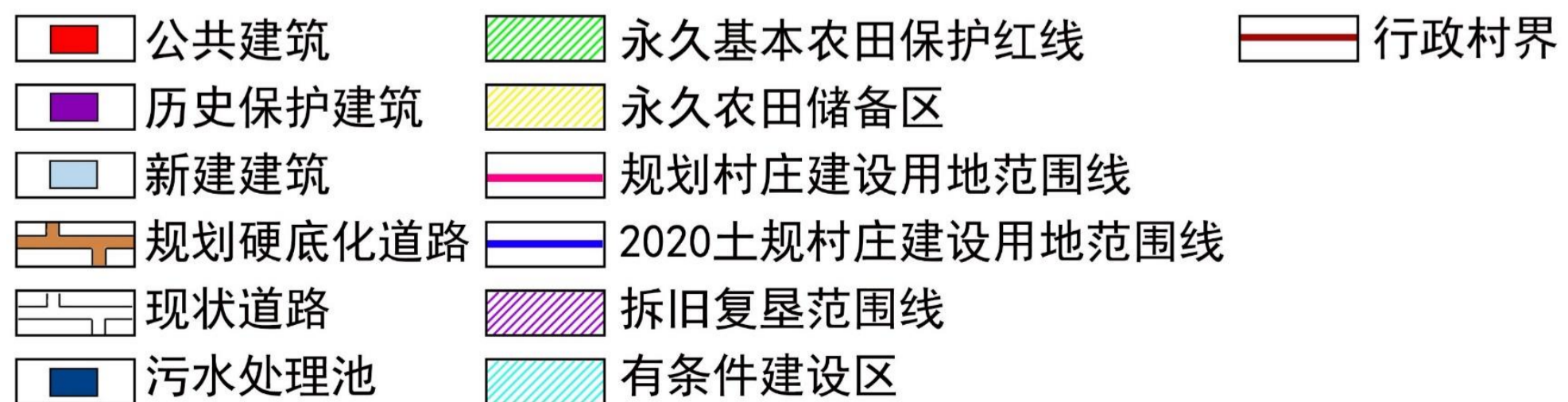
台山市斗山镇墩头村亨美村村庄规划建设项目库